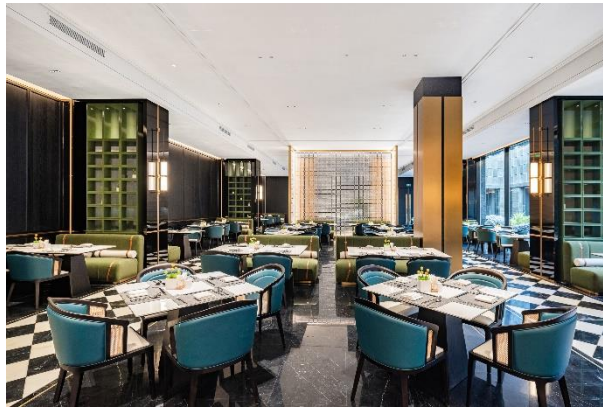
图：全日餐厅“味餐厅 WEI Kitchen”

酒店拥有两间餐厅——“ 味餐厅 WEI Kitchen ”提供早餐自助服务和全日菜单，宾客可品尝地道的本地美食； 海瑶轩中餐厅 创新结合粤菜与川菜，兼融西餐元素，为宾客呈现别具一格的舌尖美味。无论是细致入微的本地美食，还是精心烹调的中式融合佳肴，都能在重庆新世界酒店得到满足。