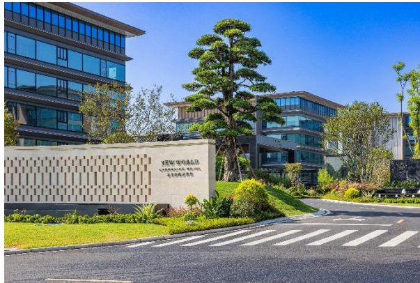
图：重庆新世界酒店

重庆新世界酒店于今日盛大开业。这间融合当地山水文化与豪华高端旅居生活方式的酒店，地处璧山御湖岛中心，毗邻国家级旅游景区秀湖公园。酒店坐拥得天独厚的地理位置和钟灵毓秀的景致风光，为宾客营造了一处远离尘嚣、可恣意游憩的山水秘境。酒店的开业标志着新世界酒店及度假村正式“落子”山城，也是品牌在内地市场快速扩张的重要里程碑。